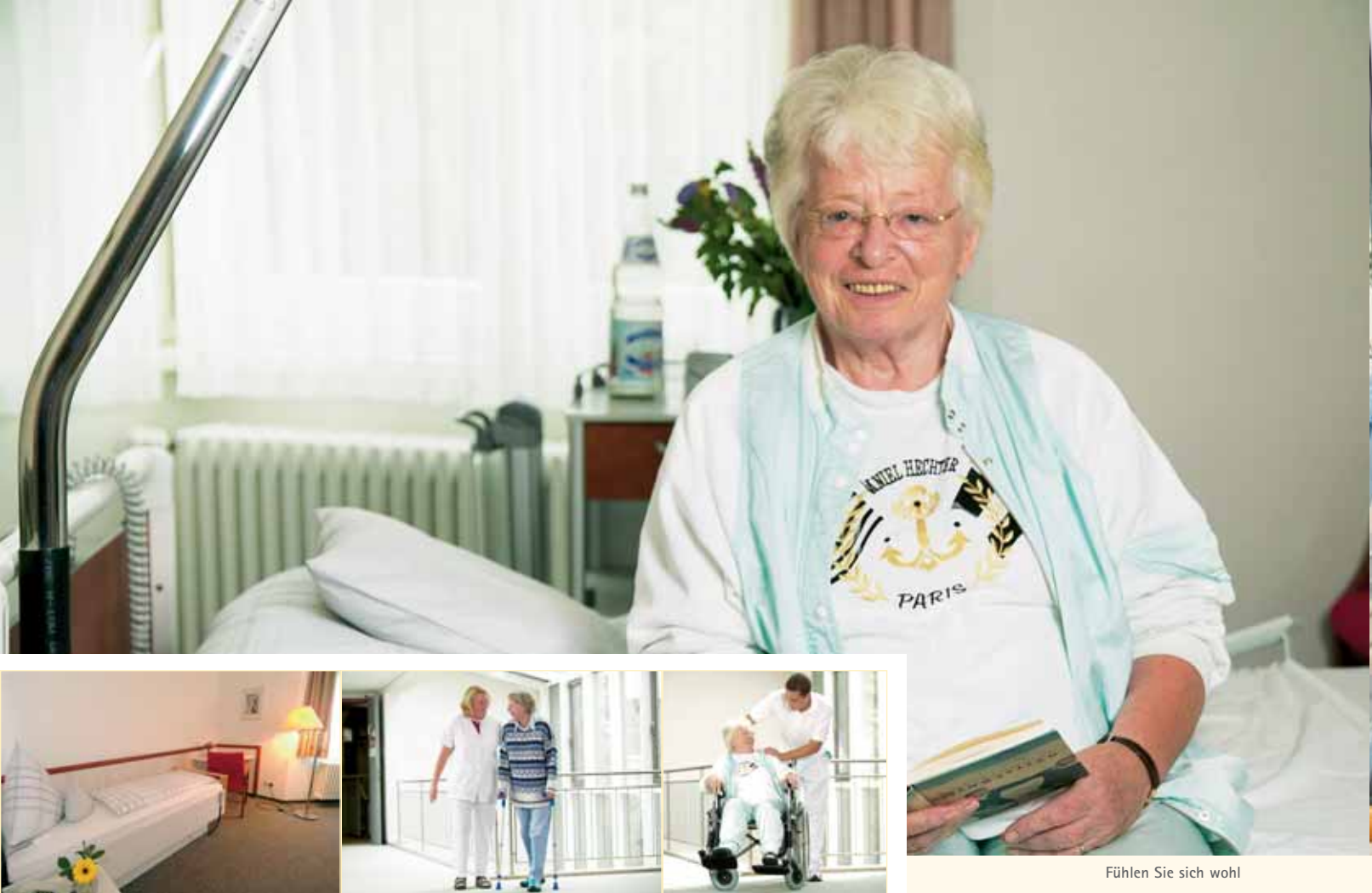
Fühlen Sie sich wohl