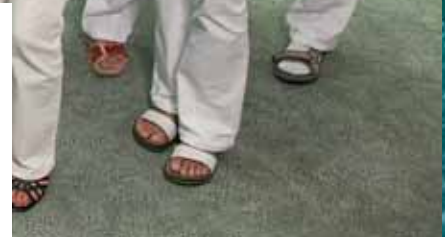
Vernetzte Kompetenz: Medizin, Pflege, Therapie