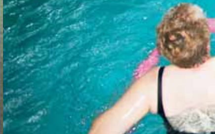
Wassergymnastik in unserem Bewegungsbad