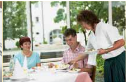
Ein freundlicher Service jeden Tag