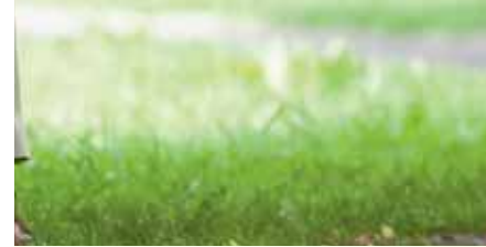
Glücklich in der Klinik im Hofgarten