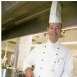
Zubereitet aus Meisterhand