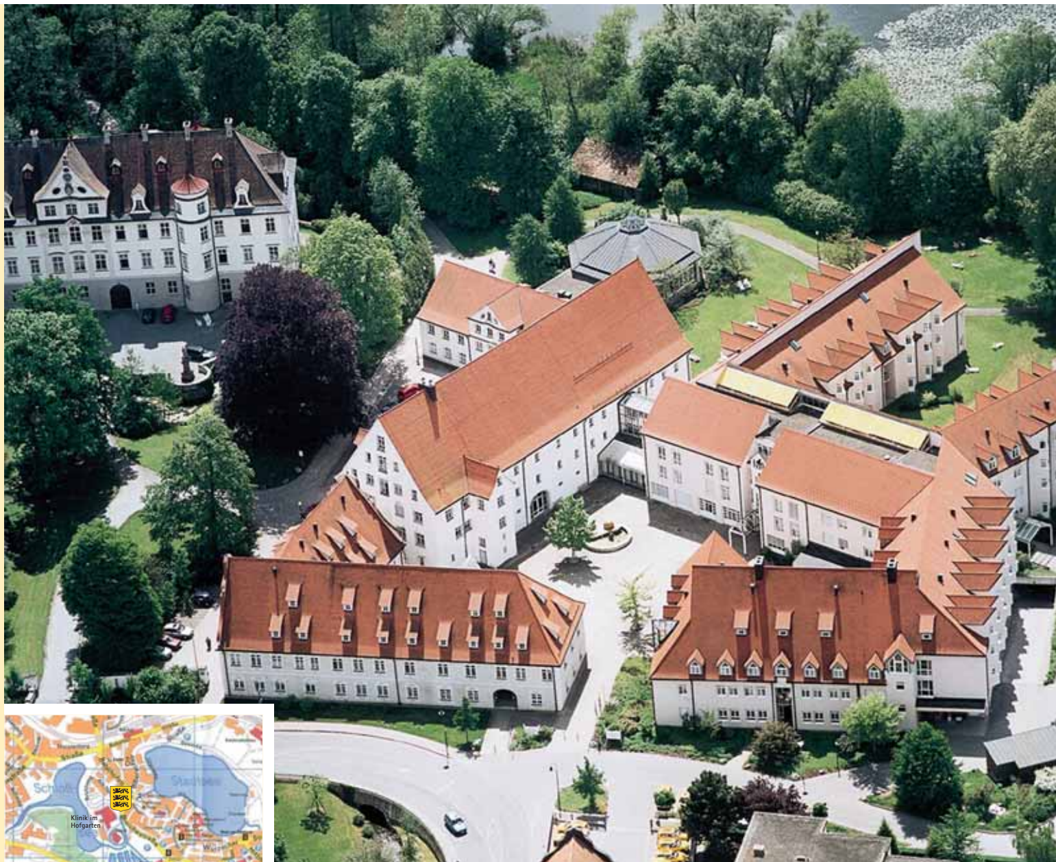
Klinik im Hofgarten

Sämtliche Bezeichnungen von einzelnen Personen (Patienten) und Berufsgruppen beziehen sich grundsätzlich auf das weibliche und männliche Geschlecht.