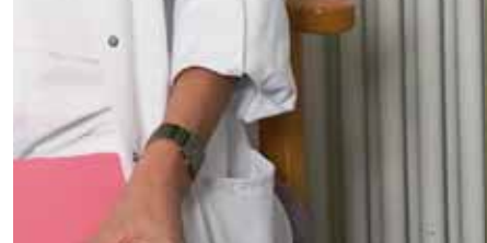
Beratung durch den Sozialdienst im Krankenhaus