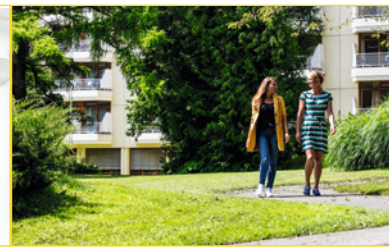
Leitbild der Klinik in Bildern